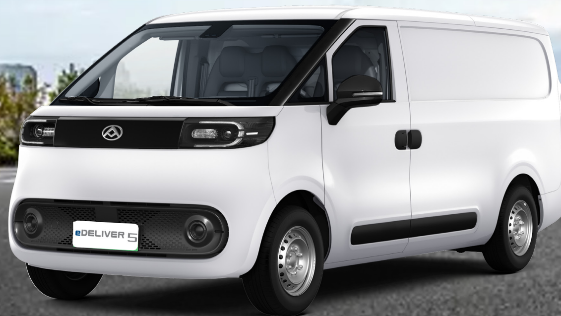
Immagine simbolica: il design e le caratteristiche del prodotto possono differire dal prodotto in vendita. Per maggiori informazioni, consultare questa brochure.